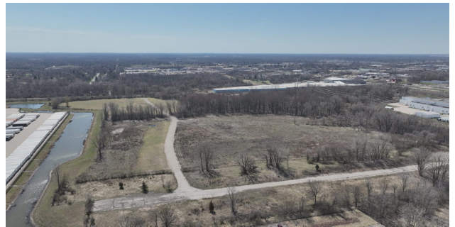
Image par drone de Davison

Fabrication industrielle, logistique, industrie desservie par rail, secteur automobile et chaîne d'approvisionnement de la fabrication de pointe