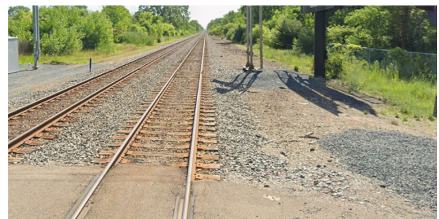
Ligne principale du CN depuis la route Genesee