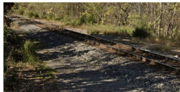
Ligne principale du CN depuis la route Elms