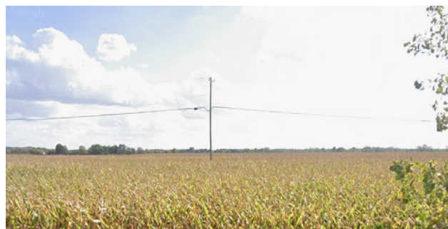
Vue vers le sud depuis l'avenue Maple.

Convient pour la fabrication, l'entreposage, la production et plus encore