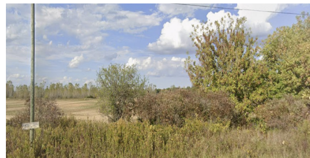
Vue vers le nord depuis l'avenue Maple.