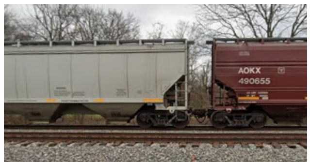
Vue de la ligne principale du CN adjacente au site.