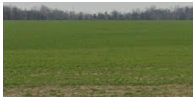
Vue depuis la route Starlanding