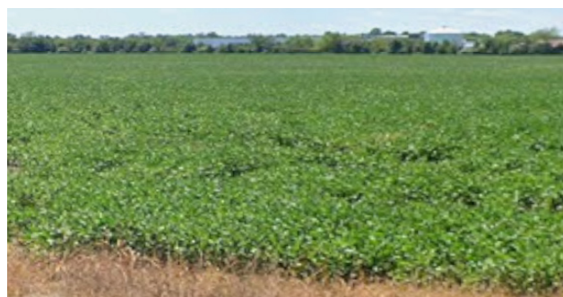
Vue du site depuis la rue Marion