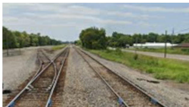
Ligne principale du CN à la route Dilinger.

Installations d'entreposage, de fabrication et d'assemblage