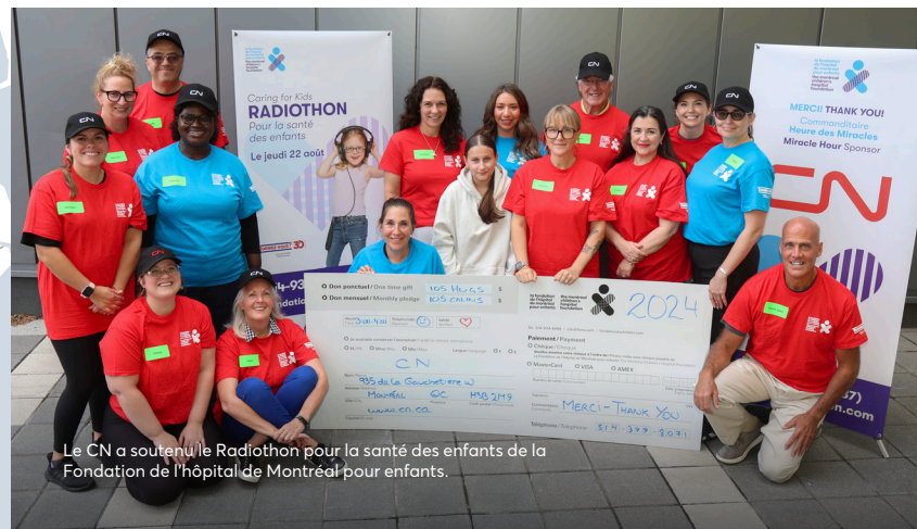
Le CN a soutenu le Radiothon pour la santé des enfants de la Fondation de l'hôpital de Montréal pour enfants.

Au cours de la dernière décennie, le CN a investi environ 4,5 G$ pour établir et entretenir un réseau sûr et efficace au Québec, ainsi que pour appuyer nos partenaires de la chaîne d'approvisionnement. Les projets d'expansion incluaient l'élaboration de plusieurs projets importants d'I et T. Les programmes d'entretien mettaient l'accent sur le remplacement de rails et de traverses ainsi que sur l'entretien de passages à niveau, de ponts, de ponceaux, de systèmes de signalisation et d'autres éléments d'infrastructure des voies.