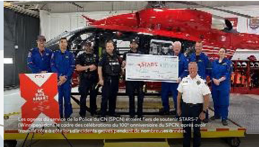
Les agents du service de la Police du CN (SPCN) étaient fiers de soutenir STARS-7 (Winnipeg) dans le cadre des célébrations du 100 e anniversaire du SPCN, après avoir travaillé côte à côte lors d'incidents graves pendant de nombreuses années.