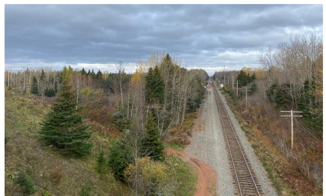
Vue aérienne en direction nord à partir de l'autoroute, avec le site à gauche

Idéal pour les activités axées sur le transport ferroviaire, y compris les secteurs agroalimentaire, des produits de bois et de papier et du transbordement