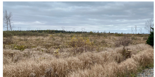
Vue du terrain déboisé en direction ouest à partir de la voie ferrée