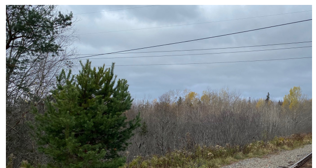
Vue du site en direction ouest à partir de la voie ferrée