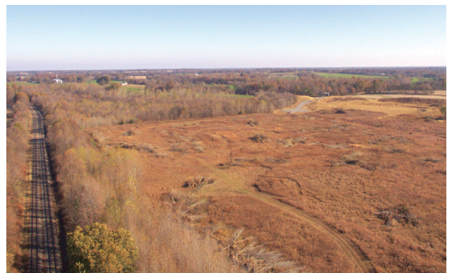
Vue vers le nord, avec le réseau du CN à gauche.