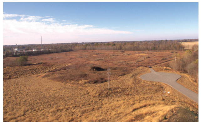
Vue en direction sud-ouest à travers le site

Site idéal pour les usages suivants, sans s'y limiter : agriculture et construction automobile