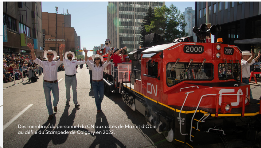
Des membres du personnel du CN aux côtés de Max et d'Obie au défilé du Stampede de Calgary en 2022.