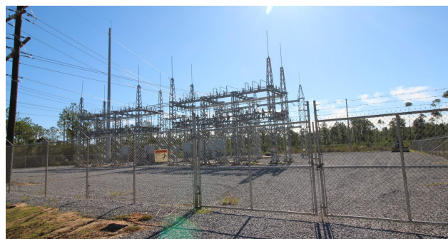
Poste de Singing River Electric situé dans le complexe industriel