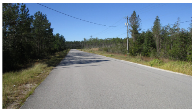
Chemin d'accès desservant le complexe industriel