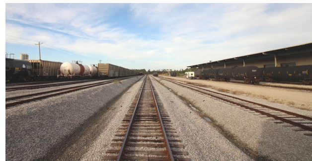
Triage de Mississippi Export Railroad adjacent au site

Installations d'entreposage, de fabrication et d'assemblage