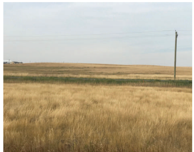
Vue à partir de la propriété

Offices de protection de la nature : Appuient le développement du site et sont engagés à cet égard