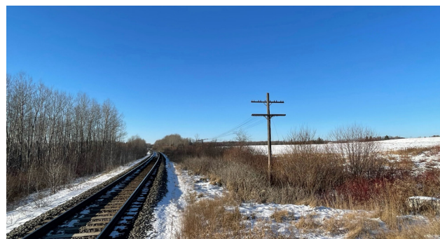
Vue en direction de l'ouest, près de la voie ferrée du CN, avec le site à droite.