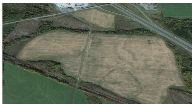
Vue aérienne du site en direction du nord, avec la route transcanadienne à droite et la ligne de chemin de fer du CN en bas.

Idéal pour les activités axées sur le transport ferroviaire, y compris la fabrication, les produits du bois et du papier, le transbordement.