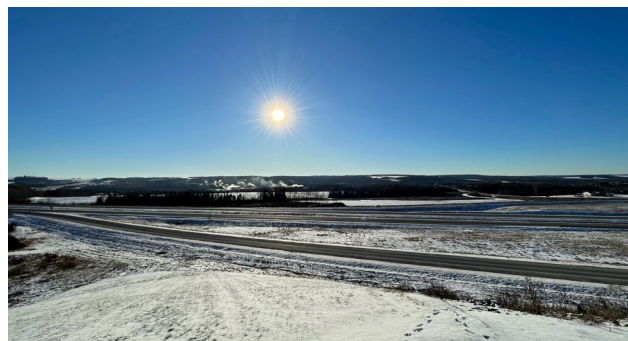
Vue de l'autoroute vers le site.